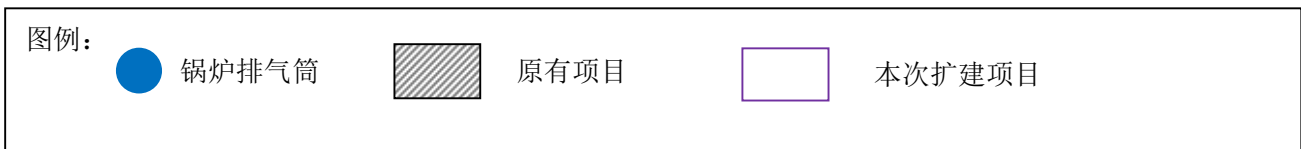
附图 3 项目总平面布置图及雨污管网图