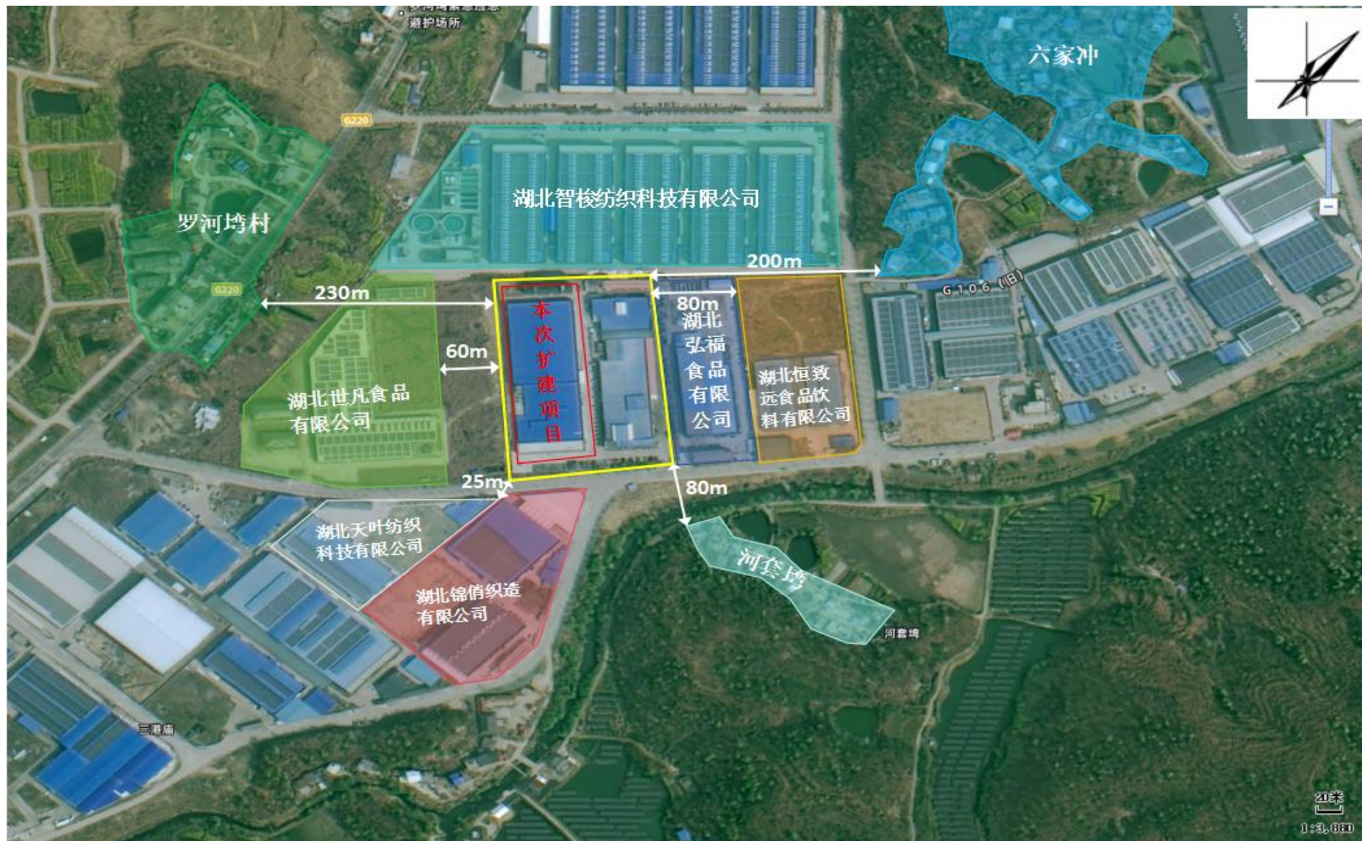
附图 2 项目周边环境关系示意图