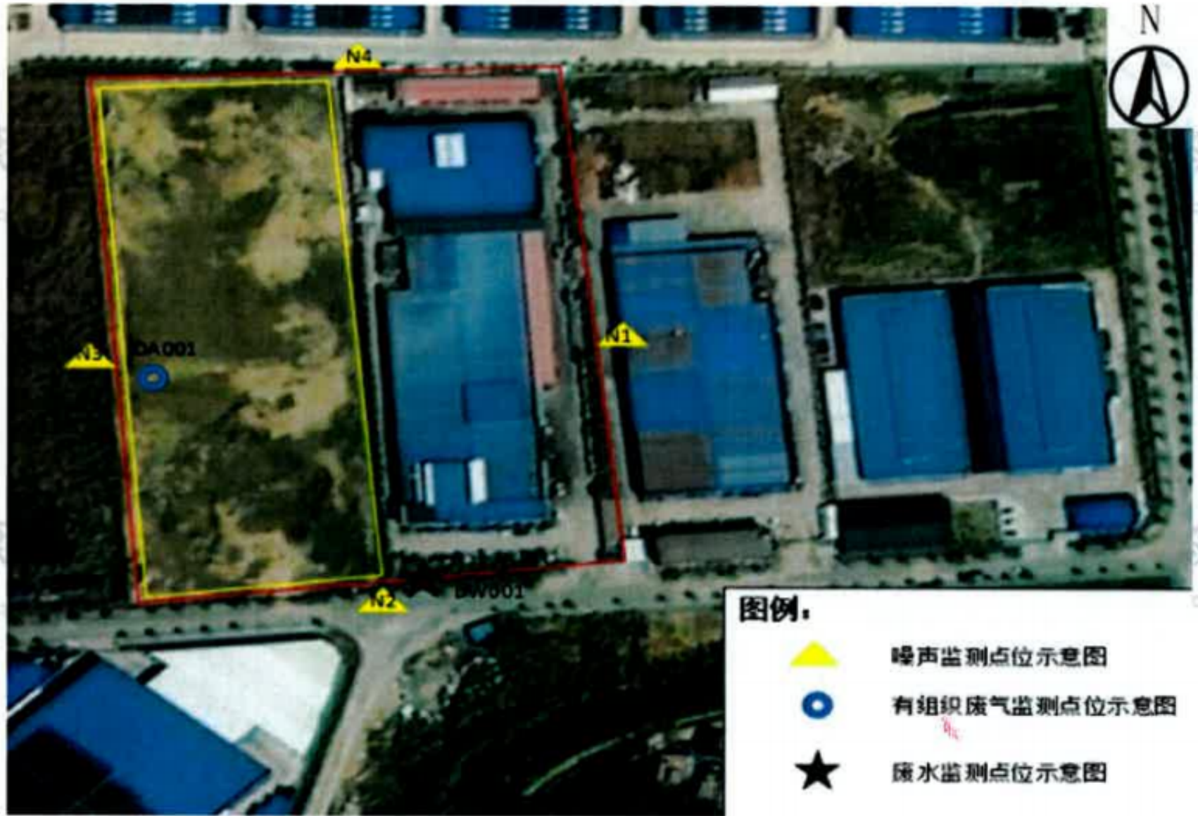
附图 4 项目验收监测点位示意图