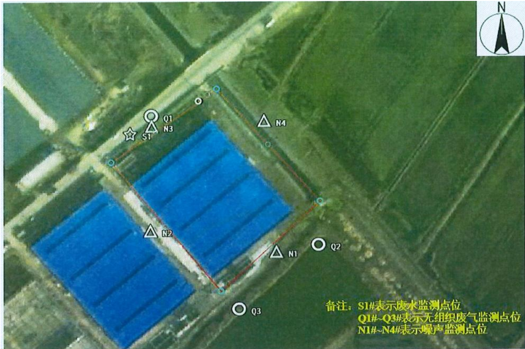
附图 4 项目验收监测点位示意图