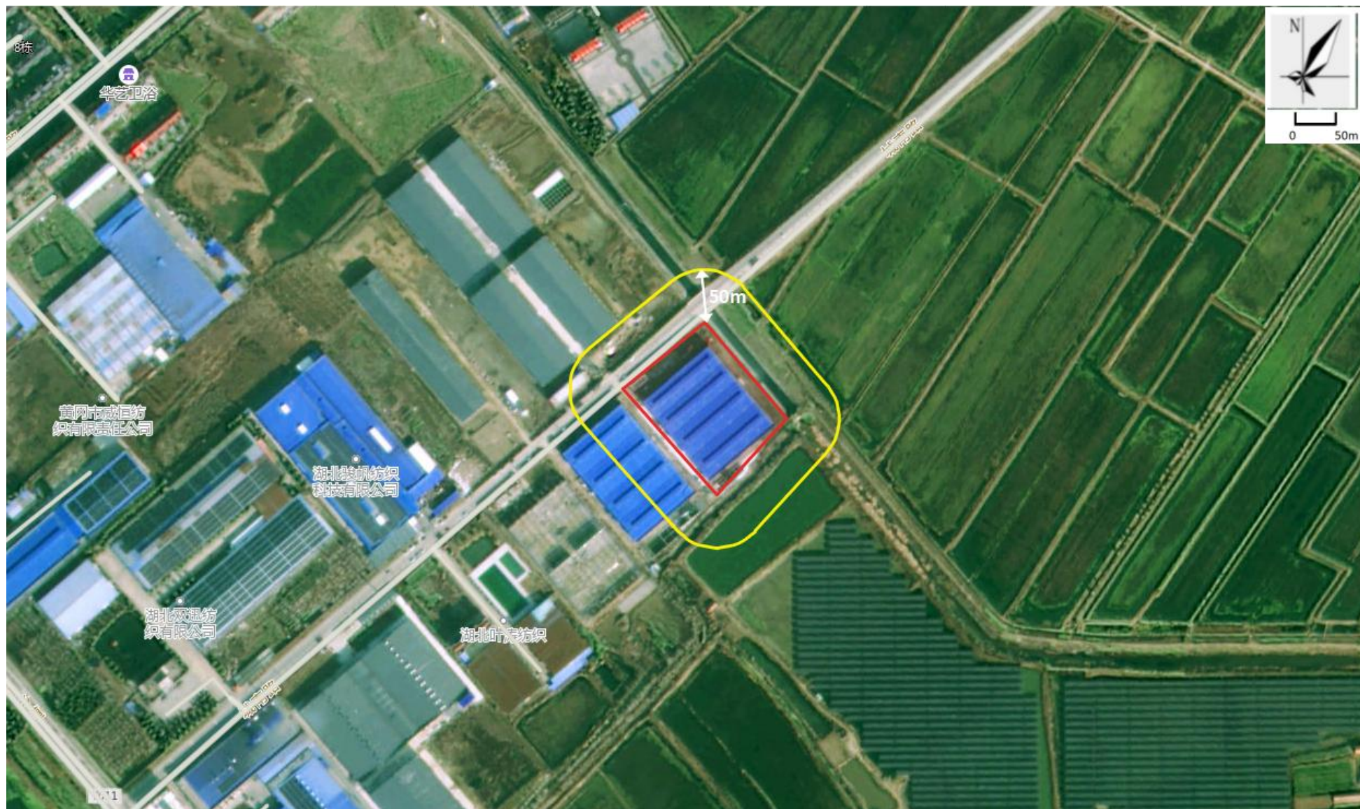
附图 5 项目卫生防护距离包络线图