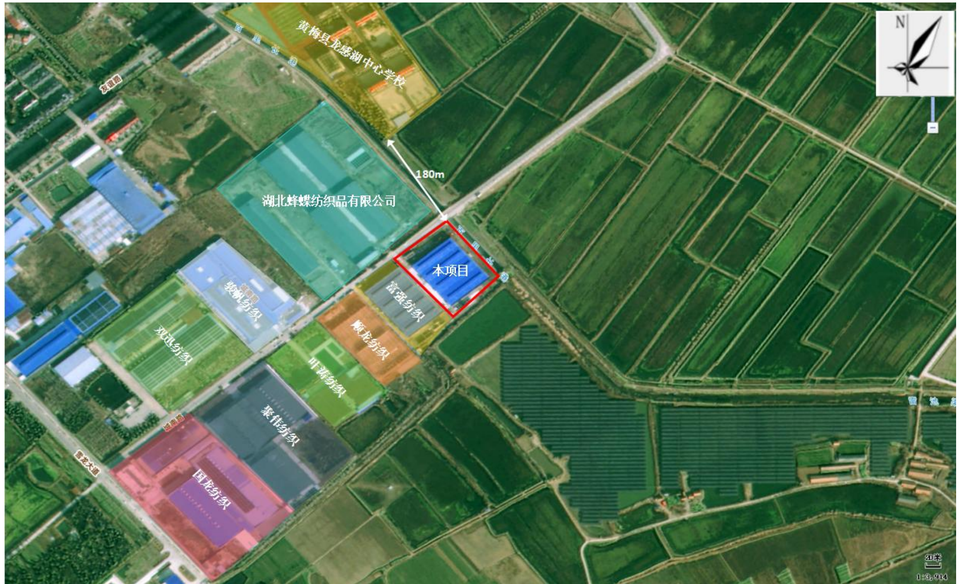
附图 2 项目周边环境关系示意图